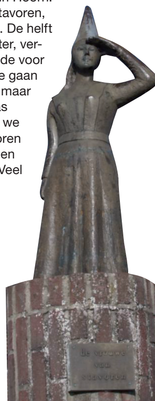
Het vrouwtje van Stavoren.